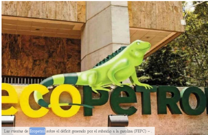
Las cuentas de Ecopetrol sobre el déficit generado por el subsidio a la gasolina (FEPC) -