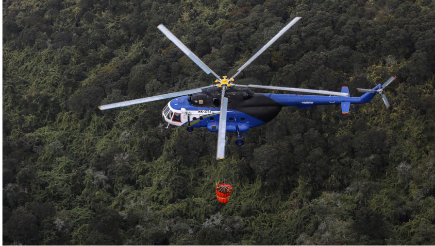
Imagen de referencia sobre helicópteros de Helistar.

El Grupo Empresarial de Ecopetrol dio a conocer que el pasado 2 de julio finalizó el plazo para que los interesados en participar en el proceso de licitación para contratar el servicio de transporte aéreo se inscribieran y Helistar Aviación expidió un comunicado en el que asegura que no tiene impedimento para participar en el proceso.