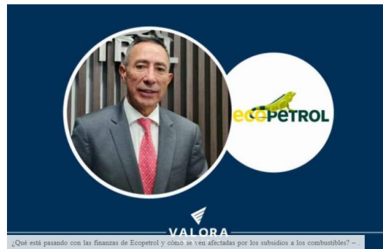
¿Qué está pasando con las finanzas de Ecopetrol y cómo se ven afectadas por los subsidios a los combustibles? - .

¿Qué está pasando con las finanzas de Ecopetrol y cómo se ven afectadas por los subsidios a los combustibles?