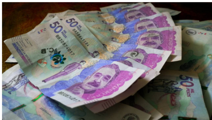
Ecopetrol tuvo que buscar financiamiento externo para cubrir el hueco que deja el déficit por el retraso de pagos.

"Esta situación ha generado un déficit en el fondo, obligando a la empresa a buscar financiamiento para cubrir la brecha presupuestal. Aunque Ecopetrol ha realizado esfuerzos para sostener el déficit, la falta de reconocimiento por parte del gobierno de los intereses generados por la demora en los pagos agrava la situación financiera del FEPC ", dijo la entidad.