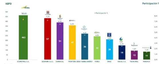
Producción de petróleo en Colombia subió en abril, pero sigue debajo de niveles prepandemia.

Adicionalmente, Campetrol expuso que el 96 % de la producción de crudo en Colombia durante abril de 2024 estuvo concentrada en diez empresas operadoras: Ecopetrol, GeoPark, SierraCol, Frontera Energy, Gran Tierra Energy, Parex, ONGC, Hocol, Tecpetrol y Perenco.