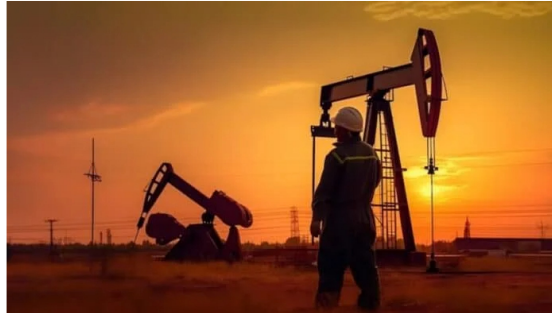
Producción de petróleo en Colombia subió en abril, pero sigue debajo de niveles prepandemia.

Los datos más recientes de la Cámara Colombiana de Bienes y Servicios de Petróleo, Gas y Energía (Campetrol) indican que la producción de petróleo en Colombia, en abril de 2024, alcanzó los 789,9 miles de barriles promedio por día (KBPD).