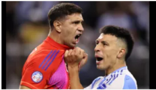
Argentina se impone en los penales ante Ecuador y avanza a semifinales de la Copa América