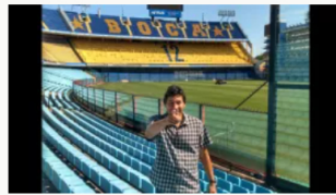
Jorge Bermúdez exfutbolista colombiano imputado por la justicia argentina