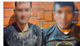
Detienen a dos colombianos en Ecuador por el secuestro de 49 personas