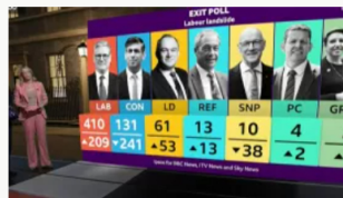
Elecciones en Reino Unido: giro a la izquierda y gana el partido laborista