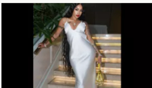
Yailín cantante dominicana número uno en redes con líos por millonaria deuda