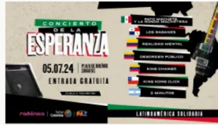
Gobierno destina $2.294 millones para realizar concierto de apoyo a Palestina y recibe críticas