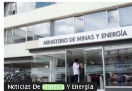
Noticias De Minería Y Energía

Moody's mantuvo calificación de Bogotá, pero empeoró su perspectiva: ¿Qué está viendo para la economía?