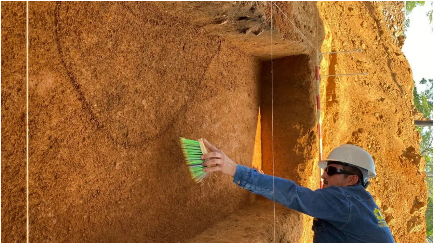
Hallazgos arqueológicos en Acacías y Guamal Meta.