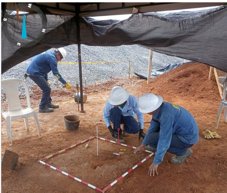
Foto: Ecopetrol / Editada / En excavación en campo 50k, Ecopetrol halló 3.000 elementos arqueológicos en Acacias y Guamal, Meta.