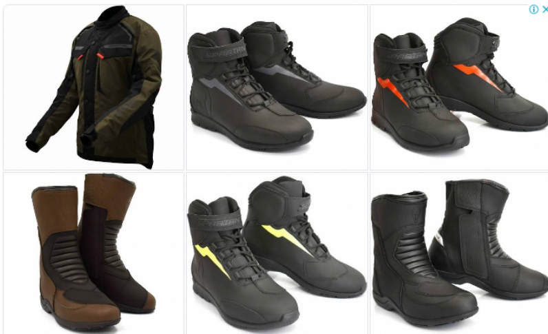
ALKOSTO Cascos para Moto Alkosto

Según un artículo del medio Bloomberg, Ecopetrol estaría en diálogos para tarer Gas Natural Licuado (GNL) de Estados Unidos