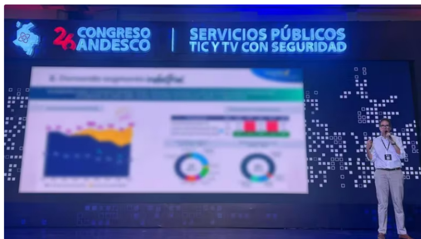
Rodolfo Anaya, en su exposición de la situación del gas natural en Colombia. La imagen de los datos fue difuminada para ser publicada en redes sociales

En el congreso de la agremiación más importante de servicios públicos en Colombia, la Andesco, que se realizó del 26 al 28 de junio, Anaya participó de una charla llamada Desafíos para atender la demanda creciente de gas natural en Colombia .