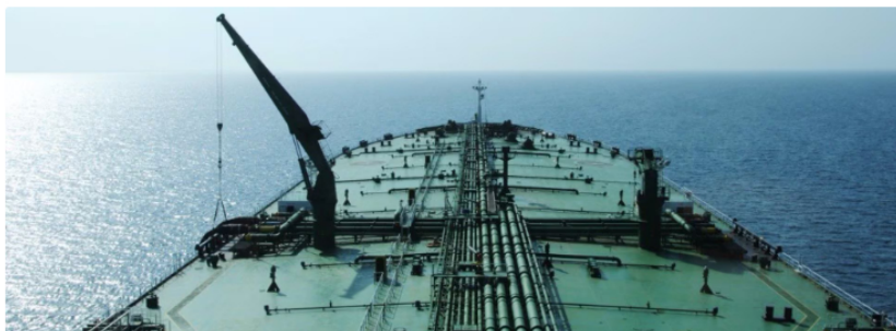
Extracción de gas en el Caribe

Ecopetrol , la empresa estatal colombiana de energía, se encuentra en negociaciones para adquirir gas natural licuado (GNL) de proveedores en Estados Unidos, que se extraería a través de la técnica del fracking , según comunicó el portal informativo Bloomberg .