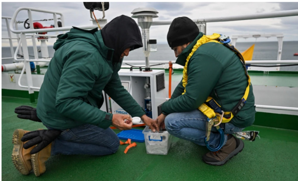
Ecopetrol descubre restos arqueológicos de comunidades precolombinas Guayupé en Colombia

En el municipio de Acacías se encontraron 3.000 piezas entre las que se destacan cinco vasijas "que serán objeto de restauración", así como piezas líticas y tallajes en piedra