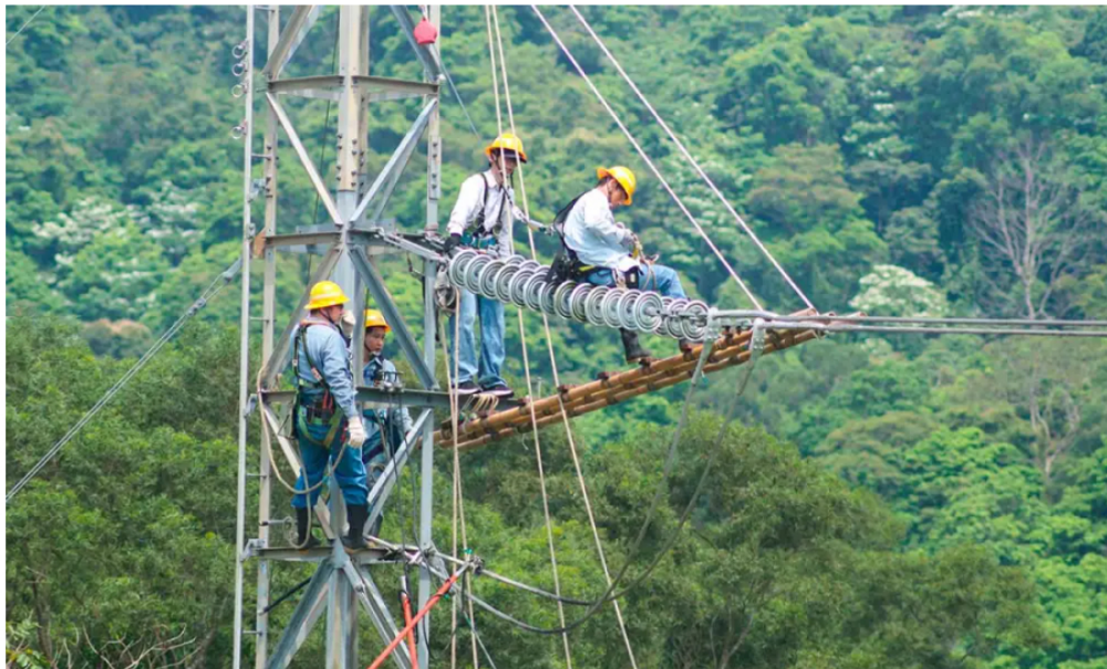
Torre de energía, imagen de referencia

Por: Redacción BLU Radio | 2 de Julio, 2024