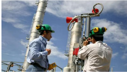
El Grupo Ecopetrol está evaluando presentar al mercado agregados de oferta a partir de un portafolio proveniente de varias alternativas de suministro de largo plazo.