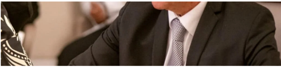
Ricardo Roa, presidente de Ecopetrol .

Ahora bien, Bloomberg aclara que no se conoce el momento del suministro, “así como la ubicación, dependerían primero del desarrollo de la terminal”.