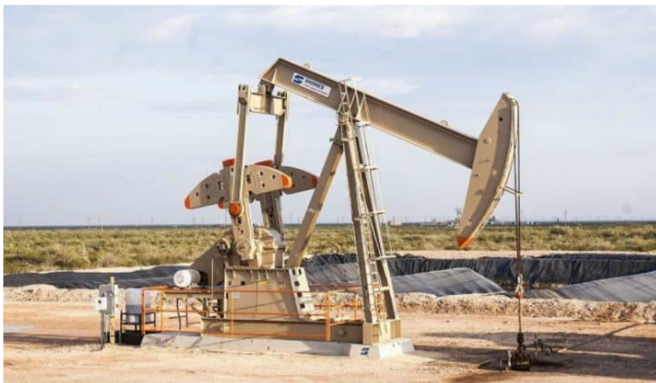
Ecopetrol estaría negociando compra de gas con Estados Unidos: Bloomberg.

Bloomberg, uno de los medios económicos más importantes del mundo, informó que Ecopetrol está en conversaciones con proveedores para comprar gas natural licuado (GNL) desde Estados Unidos.