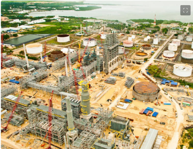
Refinería Reficar