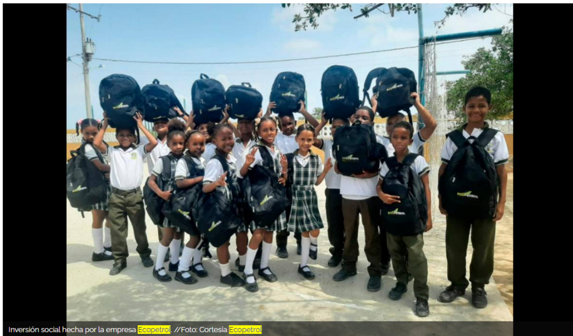
Inversión social hecha por la empresa Ecopetrol.

Con la dotación de diferentes elementos a más de 30 instituciones educativas y la entrega de kits a 13.500 estudiantes se contribuye a mejorar la calidad de la educación