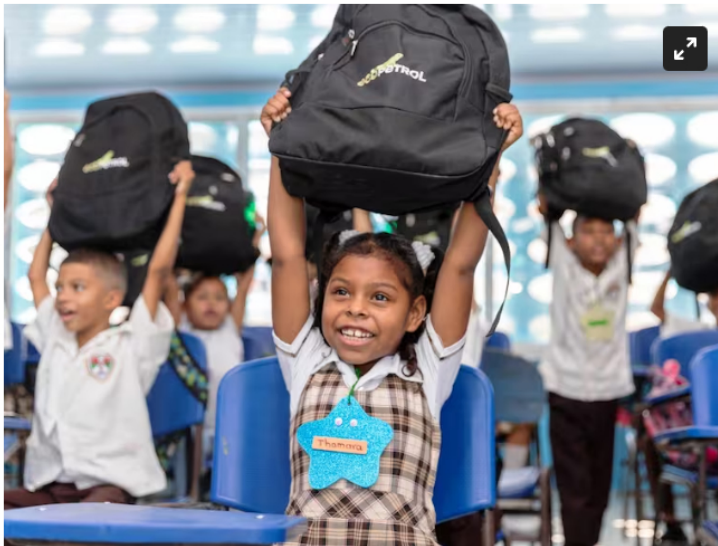
Más de 105 mil personas beneficiadas por inversión social del Grupo Ecopetrol

Más de 250 emprendedores de Cartagena, Tierra Bomba y Barú fueron capacitados para fortalecer sus líneas de negocio