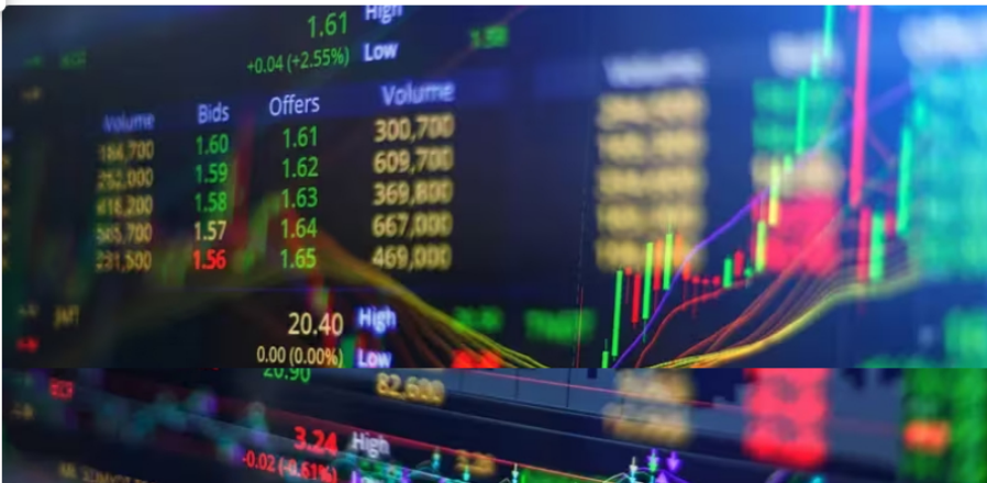
Acción de Ecopetrol cae: precio y cotización en bolsa hoy 28 de febrero de 2024

Así se comportan las acciones de Ecopetrol en la Bolsa de Valores de Colombia este 28 de febrero