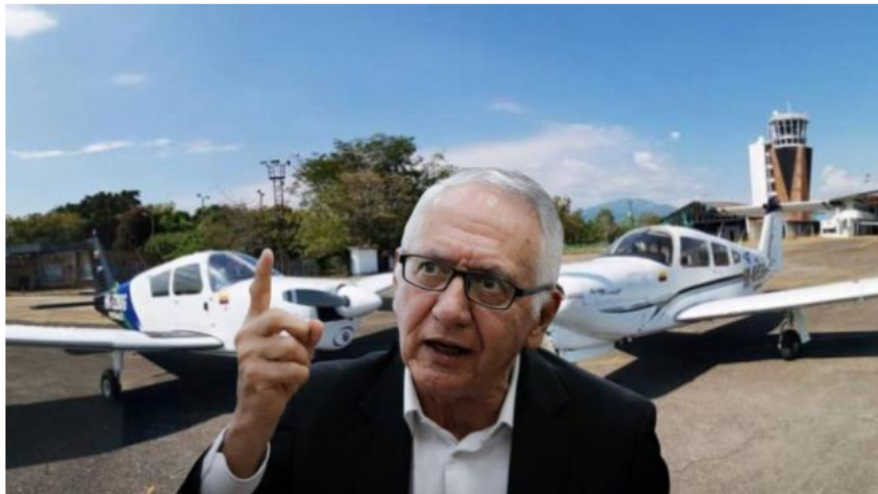
Sadi aparece en los reportes de cuentas de varios congresistas del Pacto Histórico.