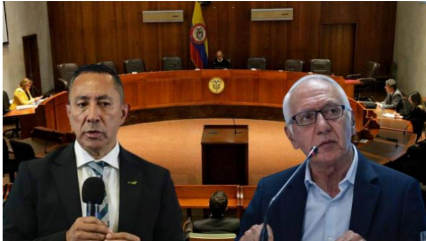
Ricardo Roa, presidente de Ecopetrol y Guillermo Alfonso Jaramillo, Ministro de Salud.

Además, que dentro de esa investigación ya se había escuchado Guillermo Alfonso Jaramillo, gerente de la campaña al Senado de esa colectividad y hoy ministro de Salud; y a Ricardo Roa, actual cabeza de Ecopetrol .