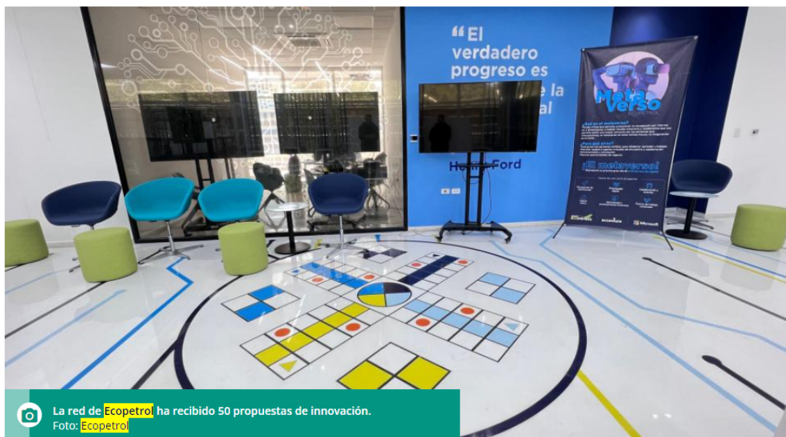
La red de Ecopetrol ha recibido 50 propuestas de innovación.

La inversión lograda durante el año se dio a más de 1.000 compañías que participaron en 38 retos de innovación abierta.