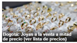
Bogotá: Joyas a la venta a mitad de precio (ver lista de precios)