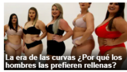
La era de las curvas ¿Por qué los hombres las prefieren rellenas?