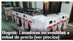
Bogotá: Lavadoras no vendidas a mitad de precio (ver precios)