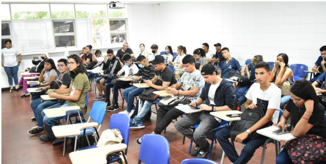
BACHILLERES DE COLOMBIA.