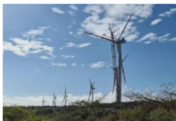
Celsia se va de La Guajira y pone en 'jaque' la transición energética del Gobierno Petro

1. El pozo fue perforado en tiempo récord (38 días) con un desempeño de 3,7 días por cada 1.000 pies perforados y un tiempo no productivo del 7 %; ambas marcas de clase mundial en operaciones costa afuera.