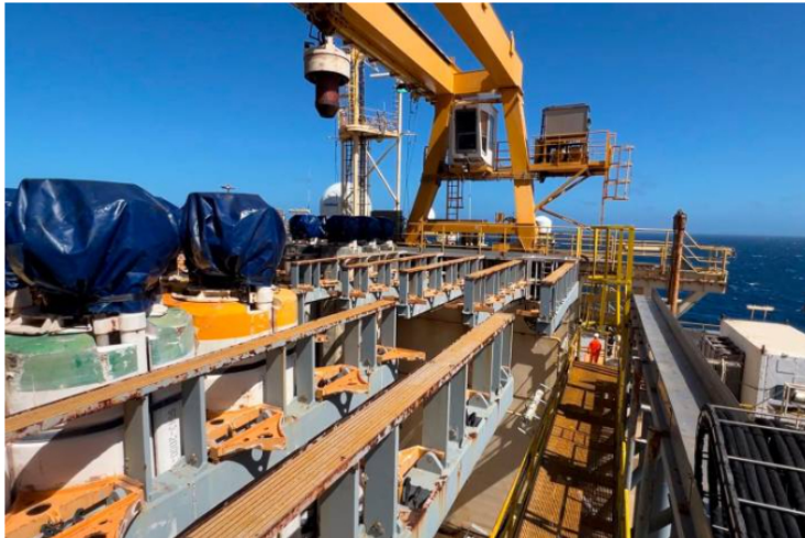
El pozo fue perforado en tiempo récord (38 días) con un desempeño de 3,7 días por cada 1.000 pies perforados y un tiempo no productivo del 7 %.