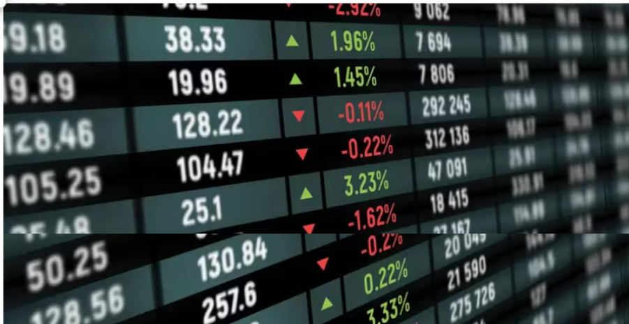
Acción de Ecopetrol , al alza: precio y cotización en bolsa hoy 22 de febrero de 2024

Así se comportan las acciones de Ecopetrol en la Bolsa de Valores de Colombia este 22 de febrero