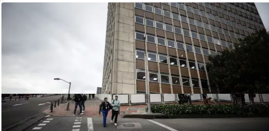
Ecopetrol no confirma potencial de gas en el Caribe colombiano

Funcionarios dijeron el jueves que estaban revaluando el descubrimiento Orca-1. La reacción de los inversionistas a la noticia fue mixta