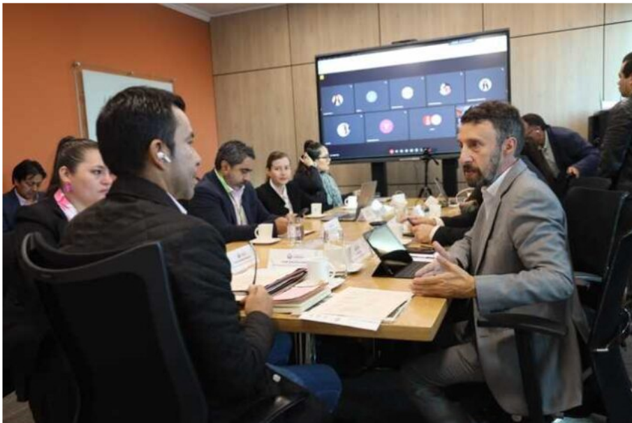
Fuente: Alcaldía Mayor. El alcalde Galán, compartió la visión que planteó el gobernador de Cundinamarca, Jorge Emilio Rey, sobre la alternancia para mostrar la voluntad e interés de articulación y coordinación en la Región Metropolitana.

Durante el primer Consejo Regional de la Región Metropolitana Bogotá – Cundinamarca de 2024, se designó al alcalde Mayor de Bogotá, Carlos Fernando Galán, como presidente de este nuevo modelo de asociatividad territorial.