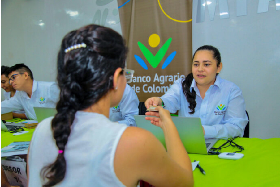
Fuente: Banco Agrario. Durante el actual Gobierno se han desembolsado créditos por más de $1,8 billones entre 135.679 mujeres rurales de todas las regiones, en tanto que la cartera actual de este segmento se acerca a $2,9 billones

El Banco Agrario recibió el reconocimiento por su programa de Educación Económica y Financiera para las mujeres rurales por parte de la Superintendencia Financiera de Colombia, en el que se destaca el compromiso de la entidad por cumplir con los requisitos de pertinencia, calidad e idoneidad para esta importante población.