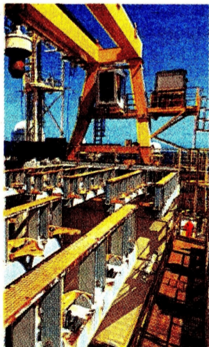
Hay la presencia de dos acumulaciones de gas. Ecopetrol

Fuentes de Portafolio señalaron que los resultados de la perforación no fueron