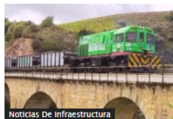
Noticias De Infraestructura

Gobierno Petro inicia obras para revivir los casi 500 km del Ferrocarril del Pacífico