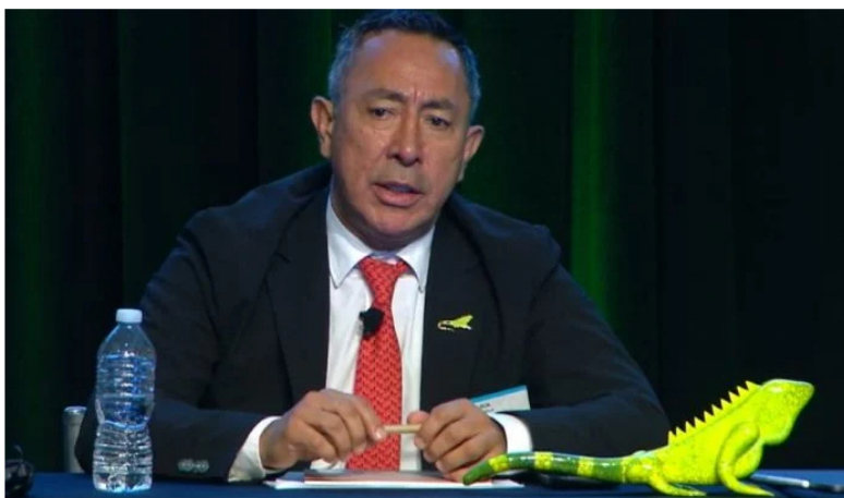
Presidente de Ecopetrol citado a declarar.