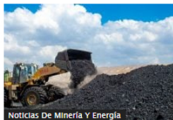
Noticias De Minería Y Energía

Gobierno Petro inicia obras para revivir los casi 500 km del Ferrocarril del Pacífico