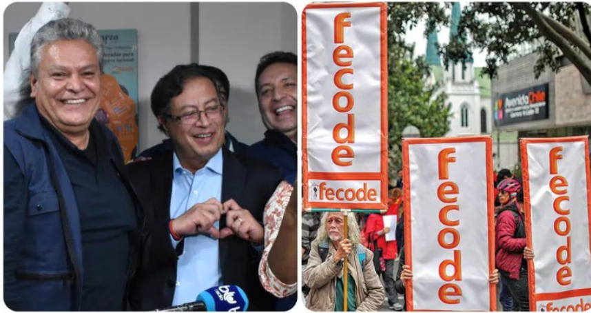
Los directivos de Fecode autorizaron 500 millones para la campaña presidencial.