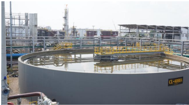
Ayudará a mejorar la calidad del río Magdalena