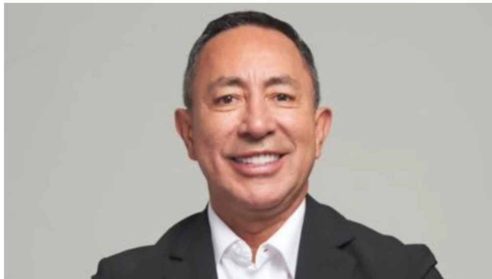
Ricardo Roa

La diligencia se llevará a cabo el próximo 26 de febrero a las 2:30 de la tarde en las instalaciones del organismo electoral. Se cita al hoy presidente de Ecopetrol , Ricardo Roa, para que declare en versión libre.