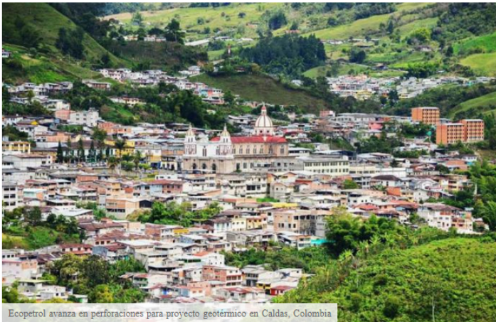
Ecopetrol avanza en perforaciones para proyecto geotérmico en Caldas, Colombia

LOCAL Stacy Local about 13 hours ago REPORT