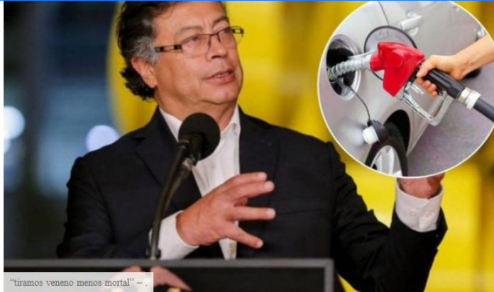
“tiramos veneno menos mortal” - .

En medio del malestar que tiene la comunidad por el aumento sostenido que ha tenido el Gobierno en el llamado cambio en el precio de la gasolina, El presidente Gustavo Petro reaccionó a las cifras dadas a conocer por Ecopetrol sobre el consumo de combustibles en Colombia.