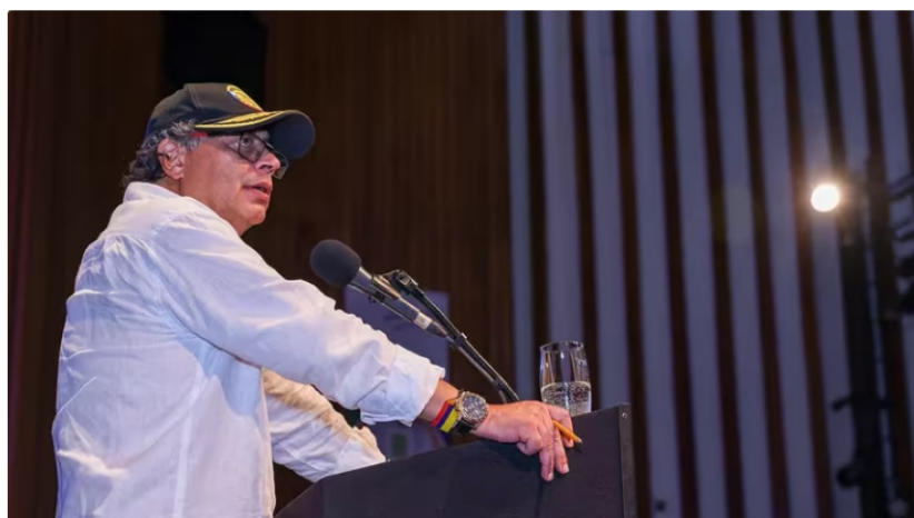
Gustavo Petro hizo críticas a la administración actual de Ecopetrol durante un discurso en la UIS, en Bucaramanga

El mandatario colombiano destacó el origen obrero de Ecopetrol , recordando su fundación en el contexto de una insurrección obrera en 1948, lo que llevó a la creación de la primera junta revolucionaria obrera en poder. “Ecopetrol fue hecha por los obreros... y por eso se fundó Ecopetrol” , citó el presidente, al señalar la importancia de volver a ese espíritu de participación y gestión cooperativa.