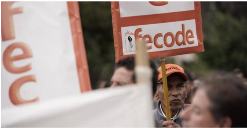
Marchas de Fecode.