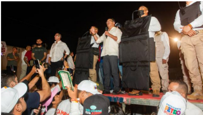
Cierre de campaña presidencial de Gustavo Petro en Barranquilla, el 21 de mayo de 2022.

No. Lo que se haga en el día de las elecciones hace parte de un elemento que se llama el control electoral; y el control electoral en la norma les corresponde a los partidos políticos el día de las elecciones y ahí ya no hay posibilidad de hacer campaña. Ingenial fue la firma contratada por la gerencia nacional de campaña en la primera vuelta. En la consulta venía desarrollando unas actividades con un alcance en el Pacto Histórico. De hecho, gracias a ese sistema y a esa plataforma fue posible recuperar creo que tres o cuatro curules de los aspirantes a Senado y Cámara del Pacto Histórico. Cuando entra el contrato de Ingenial a la campaña es para actualizar, uno, bases de datos de quienes fueran a ser los testigos; dos, hacer toda una logística de comunicaciones, y eso requería unos call centers para saber quiénes sí y quiénes no existían, y quiénes eran reales; y, tres, el hardware y el software necesarios para hacer el sistema de comunicaciones. Hasta ahí llega el alcance de la gerencia nacional de la campaña. El día de las elecciones hay que tener unos monitores, unos auditores, que estén allá reportando; entiendo que en esa ocasión se identificaron, no recuerdo cuántas, mesas críticas... Ya en el día de las elecciones, a esas personas tocaba pagarles un almuerzo, tenerles un servicio de transporte, y es a esa logística a lo que llaman el pago a los testigos, que se hizo a través de ese contrato con Ingenial.