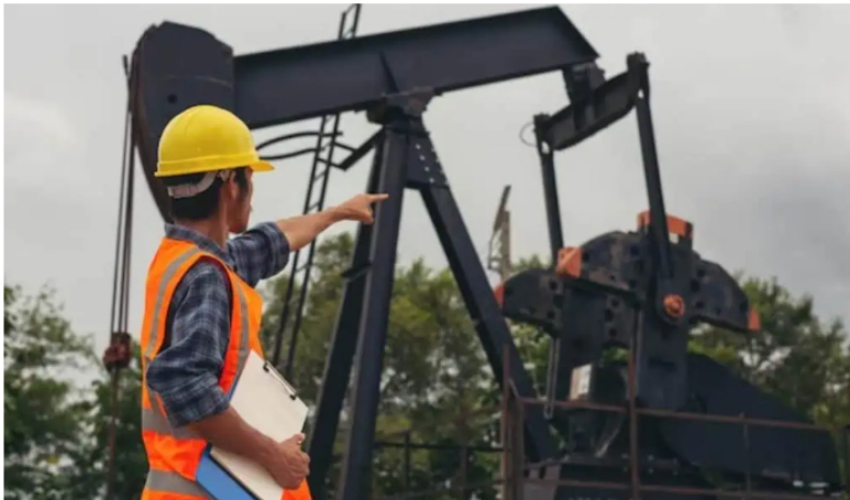
Ecopetrol y petróleo.

Este jueves 8 de febrero la empresa inició el restablecimiento de sus operaciones en los campos Caño Sur y Rubiales.