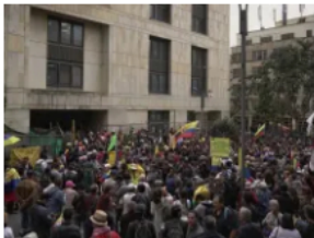
CORTE SUPREMA RECHAZA PROTESTAS VIOLENTAS EN PALACIO DE JUSTICIA Y PETRO ORDENA PROTEGER A MAGISTRADOS 8 FEBRERO, 2024