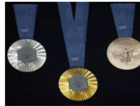
MEDALLAS DE PARÍS 2024 LLEVARÁN TROZO DE LA TORRE EIFFEL 8 FEBRERO, 2024