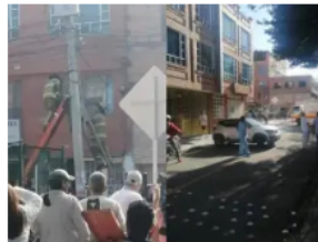
TRABAJADOR DE CONTRATISTA DE CLARD RESULTA ELECTROCUTADO DURANTE MANTENIMIENTO EN BOGOTÁ 8 FEBRERO, 2024