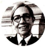
Lourdes Peña Directora nacional de Bomberos de Colombia

“La buena noticia es que estamos a punto de superar el fenómeno de El Niño. Hemos logrado unos niveles de embalses favorables. Hemos tenido lluvia inesperada que ha sido bastante importante”.