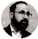
Andrés Camacho Ministro de Minas y Energía

AMBIENTE. LAS LLUVIAS HAN CALMADO LA OLA DE CALOR, PERO AL FENÓMENO DE EL NIÑO SE SUMA EL CAMBIO CLIMÁTICO Y LA SEQUÍA. FALTAN DOS MESES PARA EMPEZAR EL PERIODO NEUTRO, ANTES DE LA NIÑA