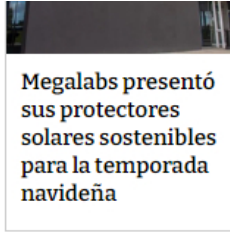
Megalabs presentó sus protectores solares sostenibles para la temporada navideña

seleto grupo de 66 compañías del mundo que obtuvieron la mejor calificación. Es un resultado producto del compromiso por buscar el equilibrio entre la creación de valor para sus accionistas, la generación de impactos positivos y bienestar para el planeta, colaboradores, clientes, comunidades de áreas de influencia y demás partes interesadas".