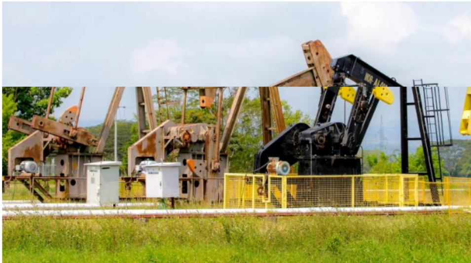
Ecopetrol logró un ahorro de energía histórico.

La petrolera dijo que, también, hizo una reducción de emisiones de 274 mil toneladas de CO2.