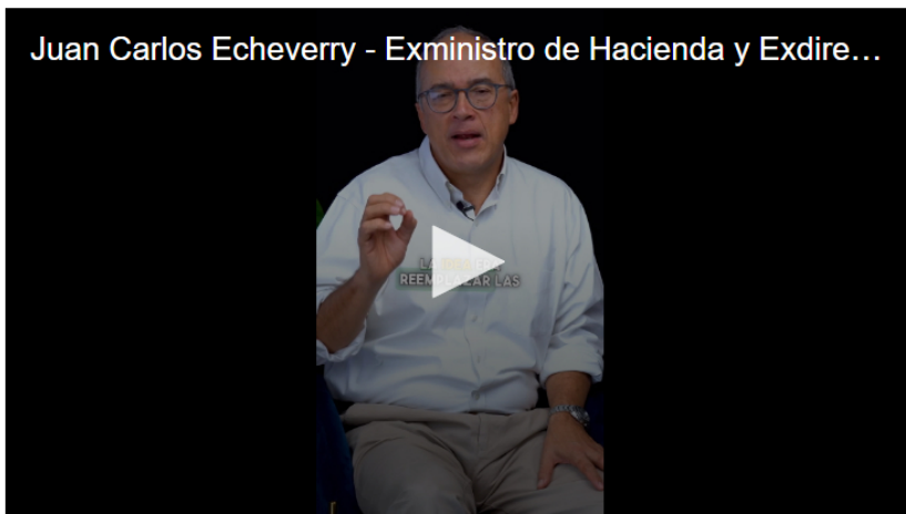
Juan Carlos Echeverry - Exministro de Hacienda y Exdire...

Juan Carlos Echeverry, exministro de Hacienda y exdirector ejecutivo de Ecopetrol, reveló detalles inéditos sobre lo que pasó con el escándalo de Reficar