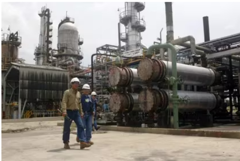
Con Reficar se buscaba reemplazar las importaciones de gasolina corriente y diésel de toda la costa del Caribe con producción nacional

Anotó que una empresa extranjera se asoció con el Estado colombiano, por medio de Ecopetrol . Esa empresa le encargó el diseño a Chicago Bridge & Irons (CB&I), que era una empresa de Estados Unidos. Una vez estaba diseñado el proyecto que se iba a hacer, Glencor le dijo al Gobierno colombiano “yo prefiero no participar en el proyecto” .