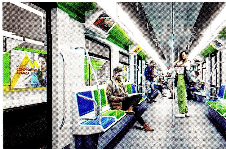
Metro de Bogotá

Según un comunicado de la Financiera de Desarrollo Nacional, FDN, el estudio de la segunda línea del metro de Bogotá “cumplió todos los requisitos técnicos, financieros, jurídicos, ambientales y sociales”. Además, comentó que no se ha cuestionado el estudio ambiental, ya que cumplió los requisitos de la Banca Multilateral, que le dio el visto bueno para acceder a los créditos correspondientes. (AR)