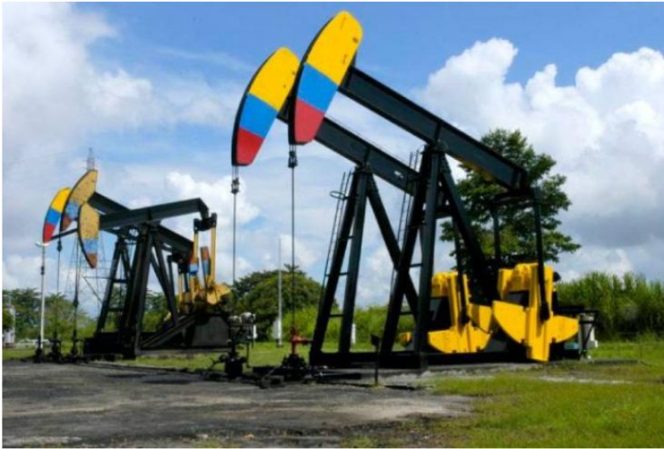
En el primer semestre del 2023, se registraron 90.836 trabajadores con dedicación exclusiva a actividades del Grupo Ecopetrol.