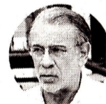
Eduardo Verano Gobernador del Atlántico

Para el Gobierno Nacional, a través del Ministerio de Vivienda, la situación extrema climática va a permanecer, por ello anunciaron focalizar las inversiones en materia de infraestructura y saneamiento básico para fortalecer los sectores del país más atrasados en este sentido. Dado que el segundo semestre hay una probabilidad de 60% para la llegada de La Niña, desde el Fondo de Adaptación asumirán las tareas de diagnósticos y soluciones para los territorios. Desde el Gobierno Central anunciaron que se priorizará el agua potable, principalmente en los departamentos de La Guajira y Chocó.