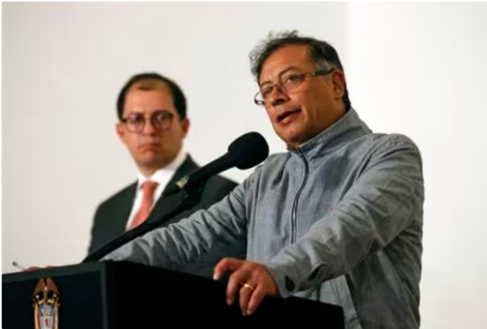
El presidente de Colombia, Gustavo Petro (d), y el fiscal general colombiano, Francisco Barbosa, en una fotografía de archivo