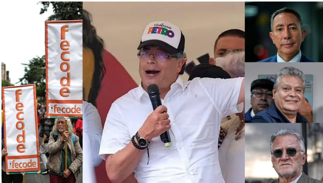
Fiscalía imputará cargos por los 500 millones de pesos que Fecode aportó a la campaña Petro. | Foto: SEMANA

3 de febrero de 2024 Por: Redacción El País