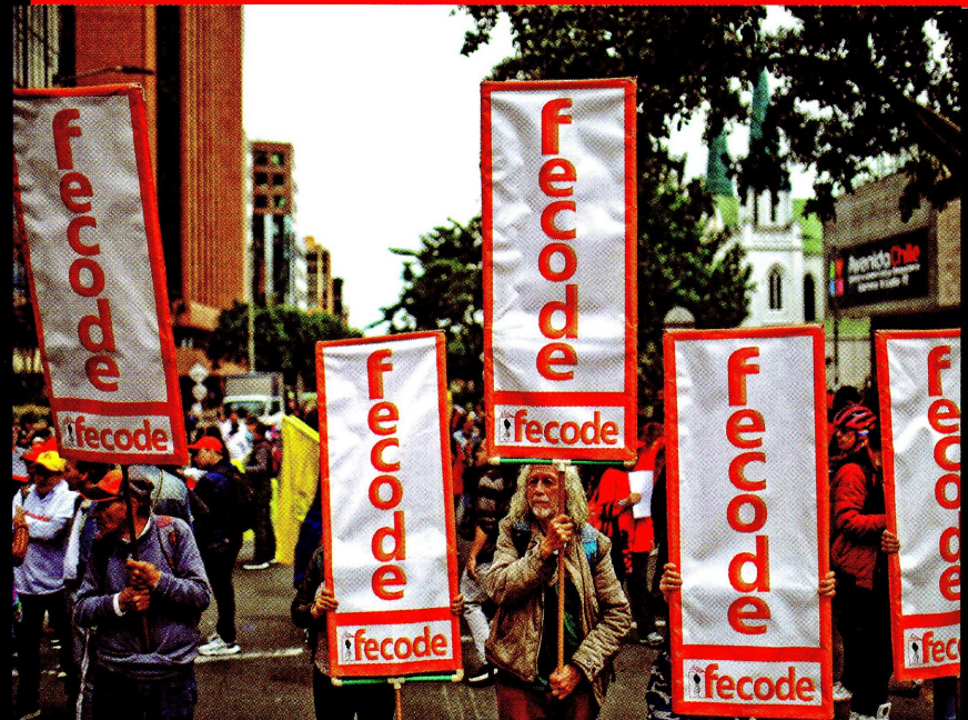
▶ El sindicato de maestros habría realizado una maniobra irregular para enviar el dinero. Lo giraron a la Colombia Humana y de ahí a las arcas de la campaña.

CONTRATO DE PRESTACIÓN DE SERVICIOS OPS - 001 - 2022 DE GESTIÓN, CONTROL, Y SEGURIDAD ELECTORAL, CELEBRADO ENTRE EL PARTIDO COLOMBIA HUMANA E INGENIAL MEDIA SAS PARTES convienen que los servicios prestados serán cancelados, previa presentación, por parte del CONTRATISTA a EL MOVIMIENTO, de la factura que corresponda a los entregables y valores que de común acuerdo se estipulan en la cláusula quinta del presente contrato. PARAGRAFO.- El pago correspondiente a la factura, se efectuará por parte de EL MOVIMIENTO al CONTRATISTA, dentro los dos (02) días hábiles siguientes a la radicación de la misma, las cuales deberán ir acompañadas del informe de gestión debidamente aprobado por el supervisor del contrato, constancia de pago de la seguridad social del contratista o constancia del contador público, según corresponda, del mes inmediatamente anterior al que se cobra, todo de conformidad a la normatividad vigente y los procedimientos establecidos por EL MOVIMIENTO. LAS PARTES convienen en construir el reconocimiento y pago del Presente Contrato de la siguiente manera: