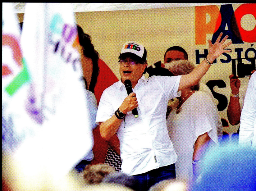
▲ El viernes en la noche, el presidente Petro lanzó un mensaje en el que advertía sobre una ruptura institucional.

Carrera 13 A # 34 - 54 Conmutador: 338 17 11 Fax: 285 3245 A.A. 14373. Bogotá D.C. Colombia E-mail: fecode@fecode.edu.co / www.fecode.edu.co