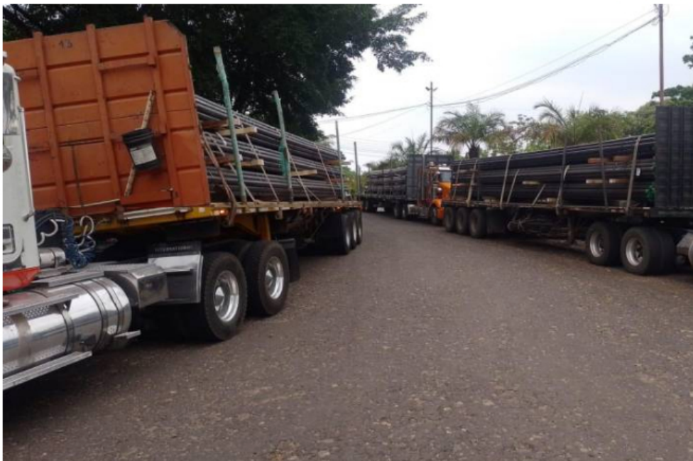
En el desarrollo de la protesta se bloquearon los accesos a las oficinas administrativas de Ecopetrol, en el corregimiento El Centro.