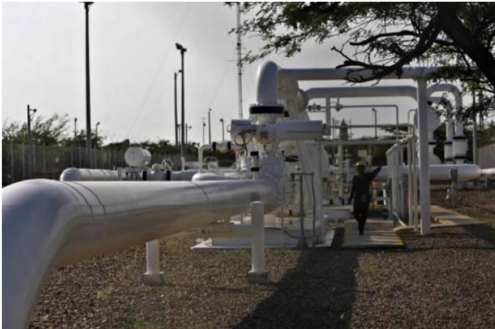
El gasoducto Antonio Ricaurte, está actualmente fuera de servicio